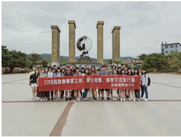
師生於恐龍谷合影