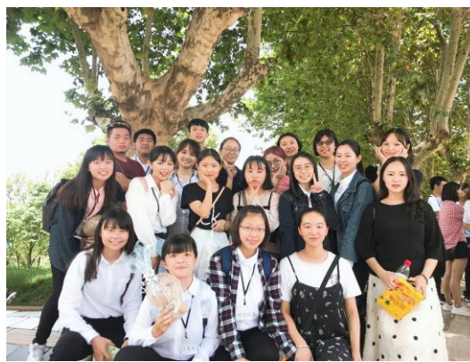
兩校學生互相交流後合影