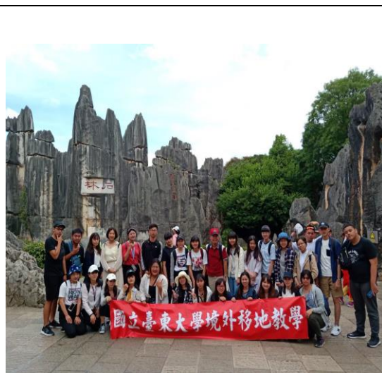
師生於石林前合影