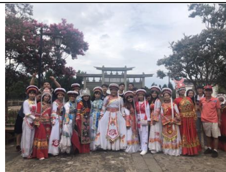
同學們著白族傳統服飾留影紀念