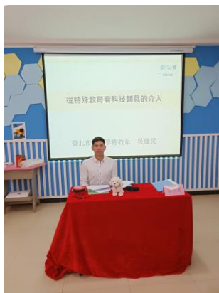
我方代表介紹輔助科技介入特殊教育