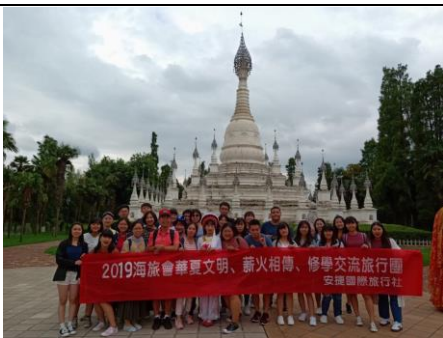
師生於少數民族建築前合影