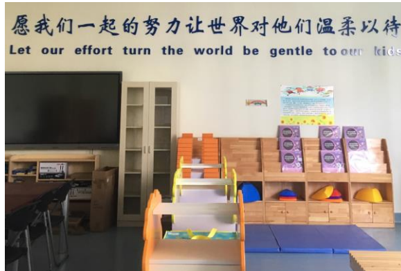
昆明學院資源教室