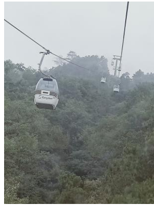
搭乘蒼山感通索道