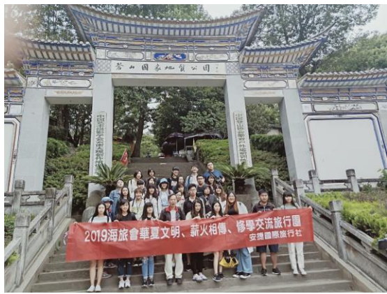
師生於蒼山口合影