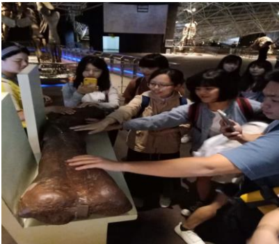
同學們觸摸恐龍化石