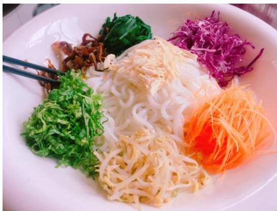
七彩雲南-七彩拌麵