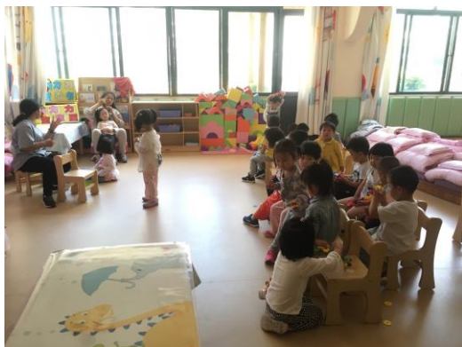
參訪昆明學院附屬融合教育幼兒園