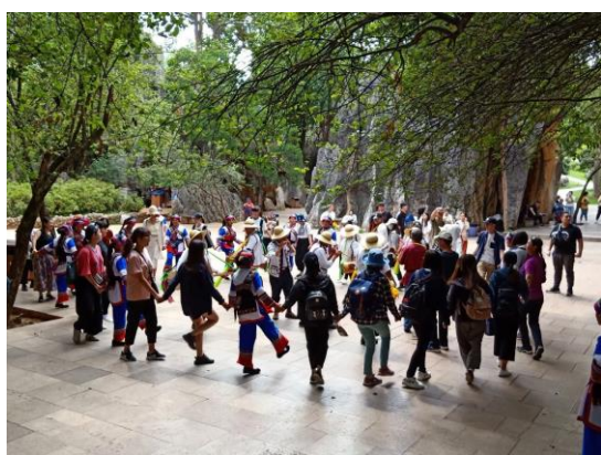
師生與少數民族共舞融入當地居民