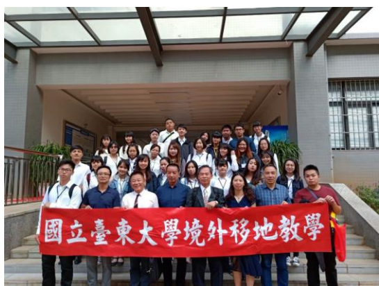
全體移地教學師生 於雲南工商學院合影