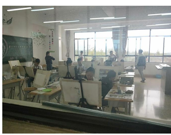
學校學生正在進行繪畫課程