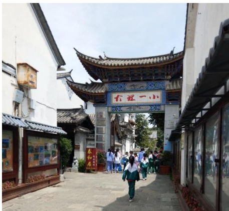
藏身於街道中的大理一小