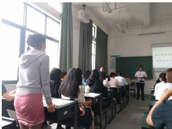
昆明學院學生的提問與回饋