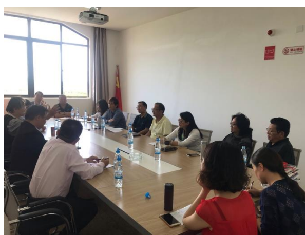
兩校師長參與座談會