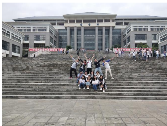
昆明學院學生帶領學生逛校園