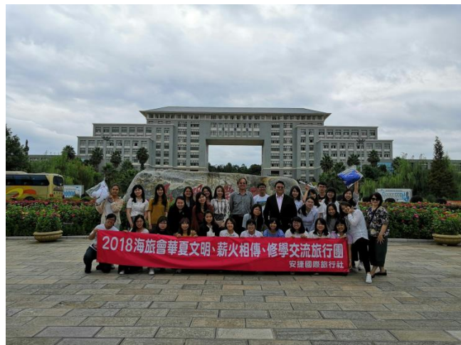
師生於校門口合影