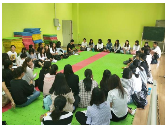
與昆明學院學生的交流活動