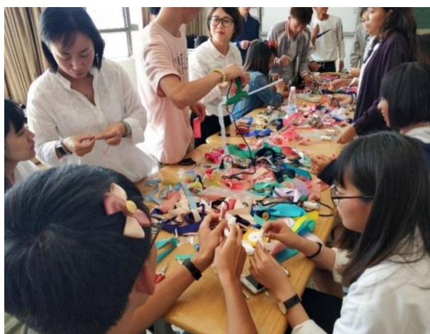
學生參與手作課製作髮飾