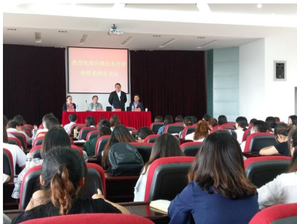
歡迎儀式互相介紹學校特色