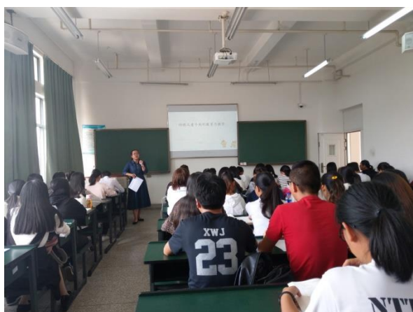
參與昆明學院特教系課程

學生分組參與昆明學院特教系課程，分享兩地特殊教育之異同，與昆明學院學生進行交流。