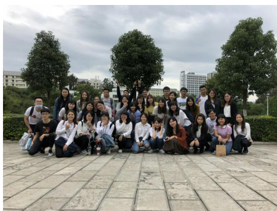
兩校學生交流後合影