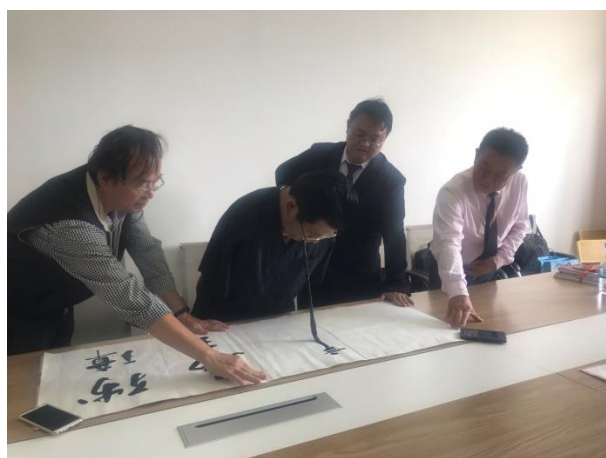
雲南特殊教育職業學院老師書法表演

兩校老師參與座談會，談論學生畢業規劃、課程安排看法等等；學生進入班級參與體驗身心障礙學生課程。