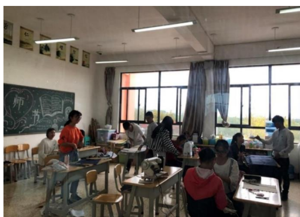
學生參與縫紉課程