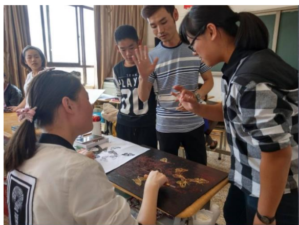
學生體驗雕刻版畫課程