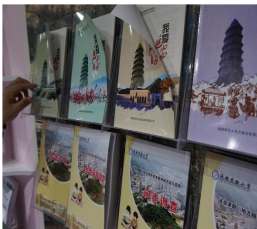
延安實驗小學—教科書