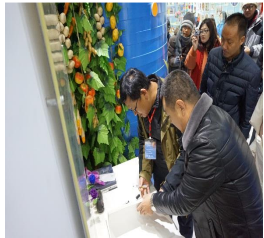
參訪延安實驗小學