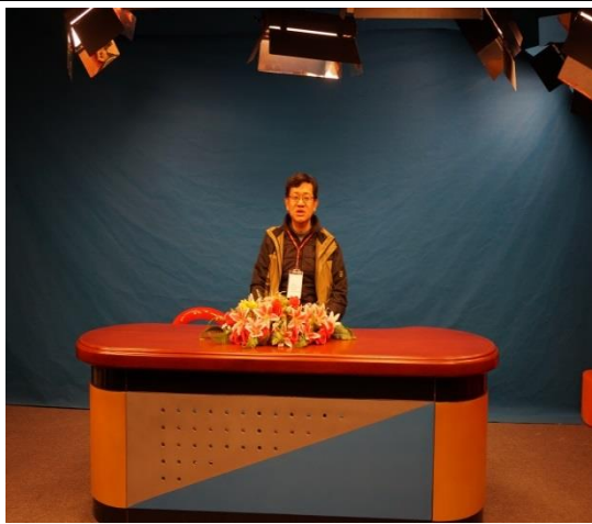
延安實驗小學—少兒電視台