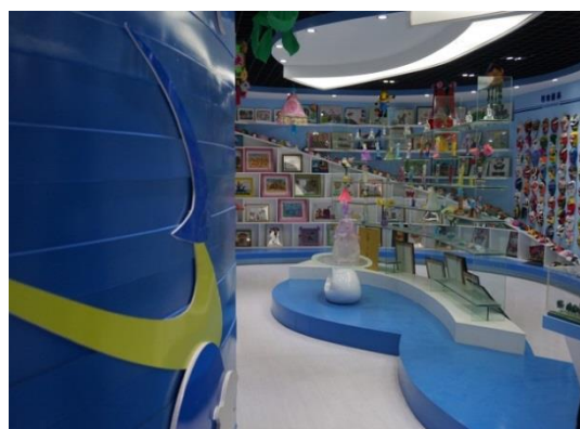
延安實驗小學—德育展室