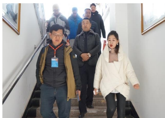
參訪延安實驗小學