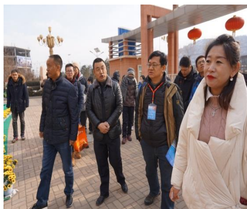
參訪延安實驗小學