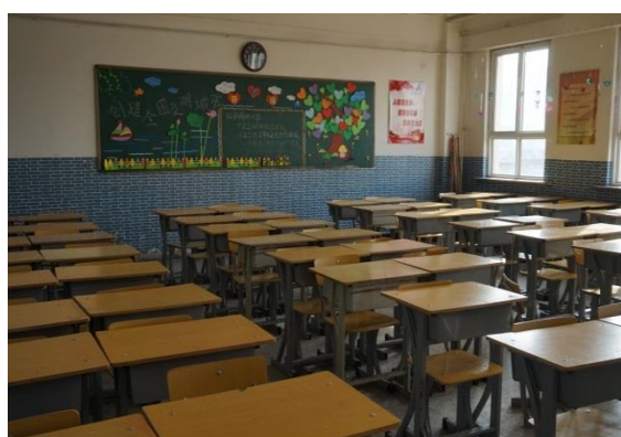
延安實驗小學教室