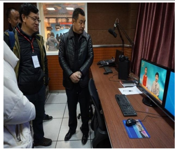
延安實驗小學—少兒電視台