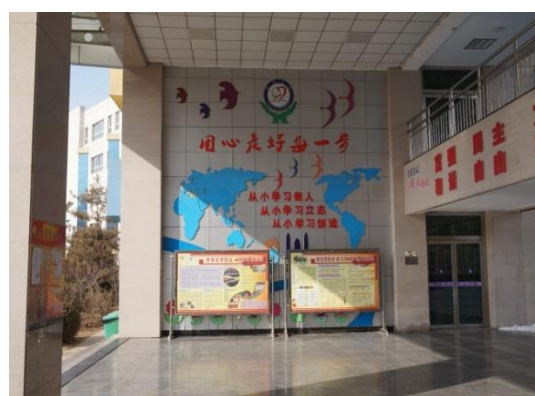
延安實驗小學一角