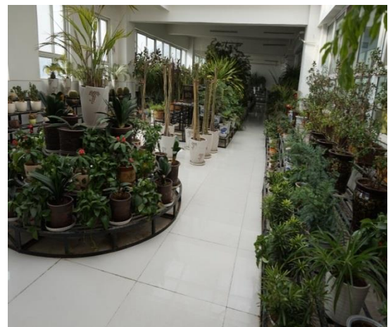
延安實驗小學—植物室